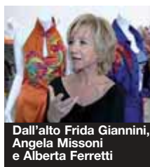
Dall'alto Frida Giannini, Angela Missoni e Alberta Ferretti